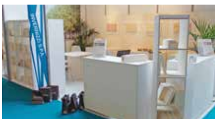
■ Stand Expo