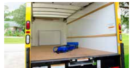
■ Commercial Vehicles