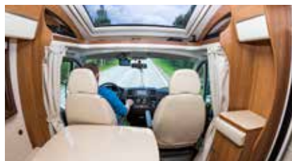
■ Camper - Caravan