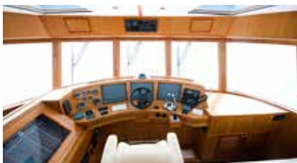
■ Marine Yachts